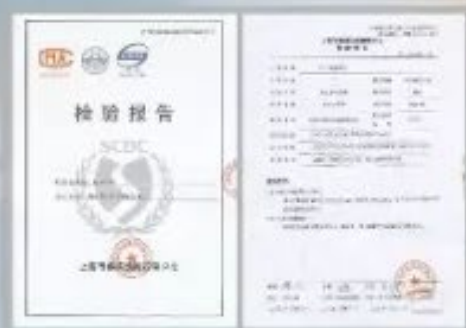
上海疾控中心 经口/皮肤毒性检测报告