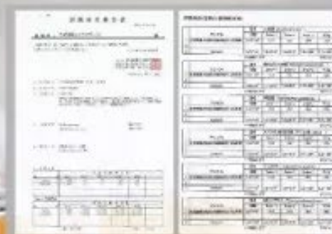
日本京都微生物研究所 杀菌抑菌检测报告