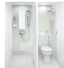
金属が錆びません