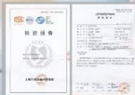
上海疾控中心 杀菌检测报告