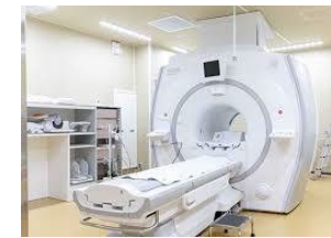
電子機器を痛めません